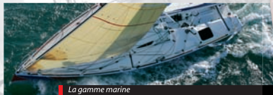
La gamme marine